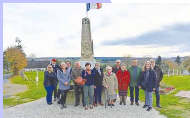
Nous avons terminé cet après-midi avec un temps de recueillement au monument aux morts.