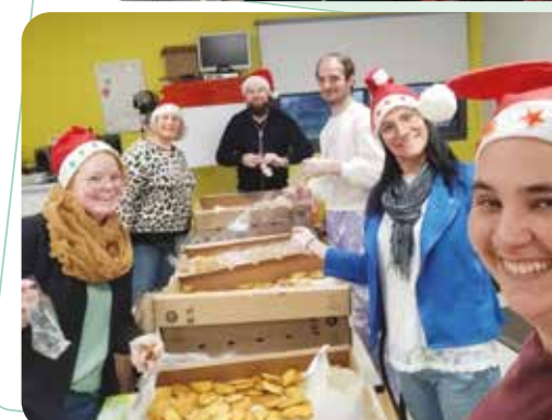
Un beau travail collectif des élèves, des parents, des enseignants et du personnel communal de l'école du Courbençon pour un Noël gourmand.