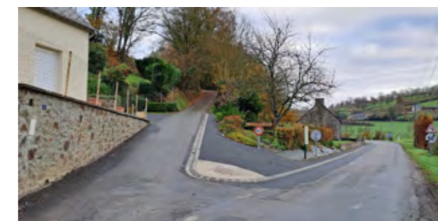
Le Pont de Malloué : Travaux de sécurisation du hameau