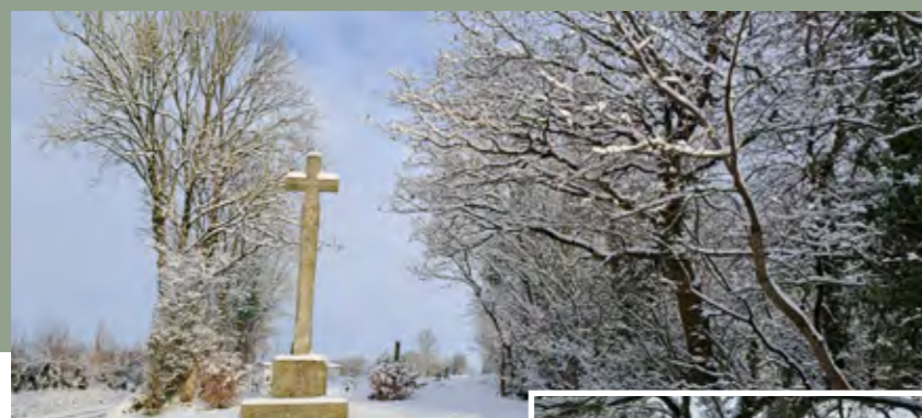
Les épisodes neigeux de janvier et novembre 2024