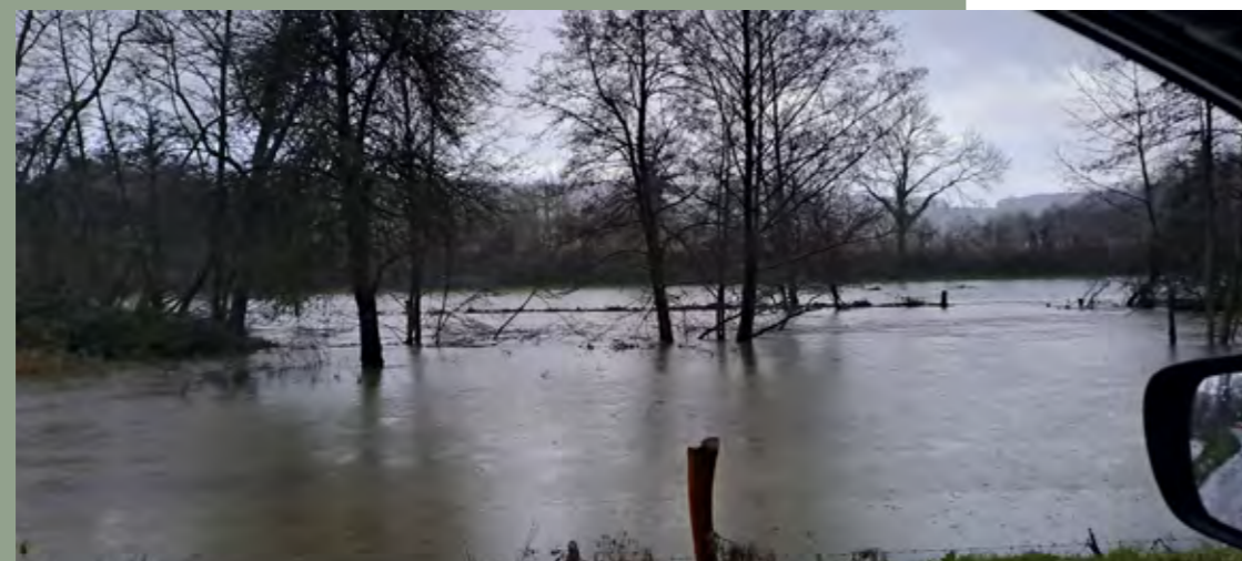
Les inondations de janvier 2024