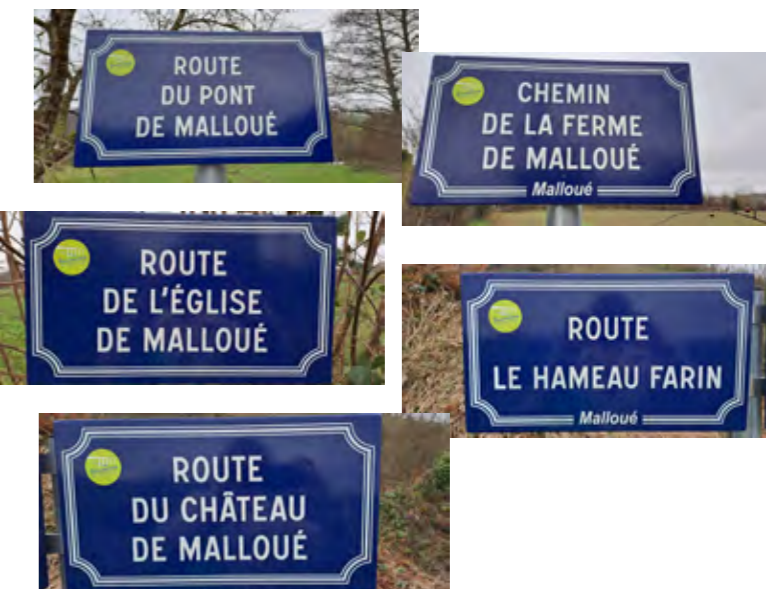
Le Moulin Rose : Pose de panneaux de signalisation

Vous avez reçu votre nouvelle adresse, celle-ci permet une localisation précise de votre habitation et permettra de résoudre les problèmes d'acheminements de courrier, colis, raccordement de fibres et surtout l'arrivée des secours. Le comité consultatif de Malloué souhaitait conserver la base des noms des hameaux. Seules deux voies ont été modifiées, Route du Château de Malloué et Route de l'église de Malloué (Mitoyenne avec Bures les Monts).