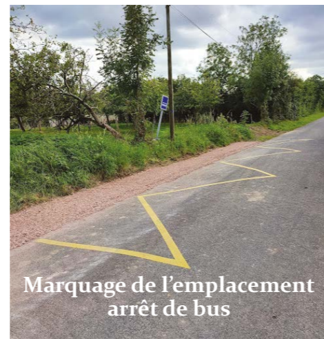
Marquage de l'emplacement arrêt de bus