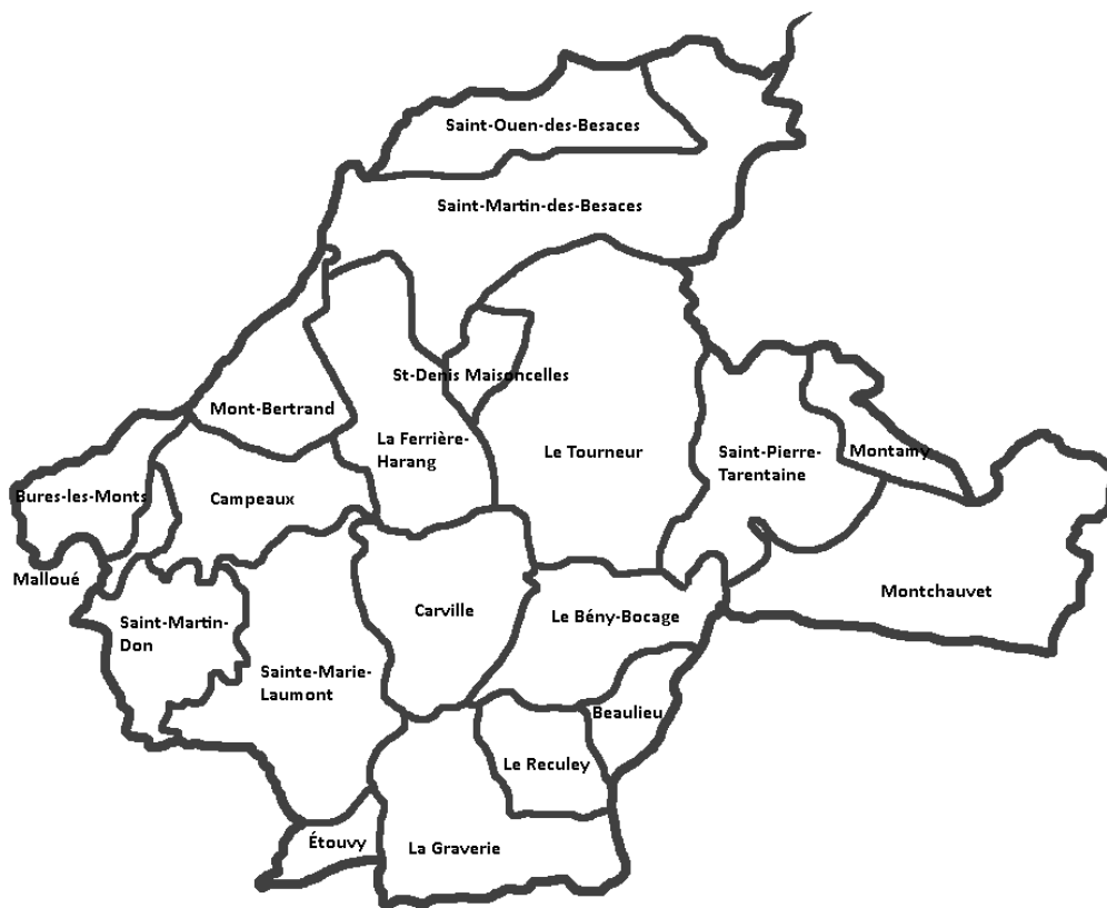
Territoire de Souleuvre en Bocage

Il est entendu par réseau routier : les voies communales, les chemins ruraux et les chemins cadastrés.