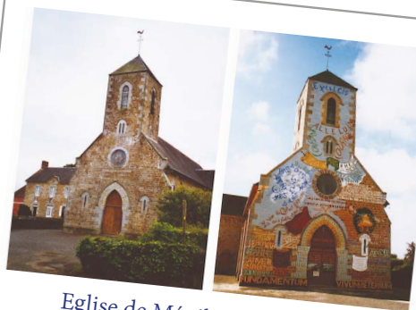
Eglise de Ménil-Gondouin