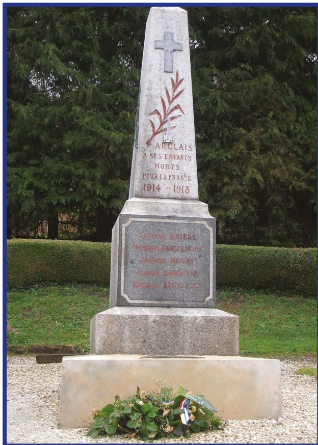
MONUMENT AUX MORTS D'ARCLAIS