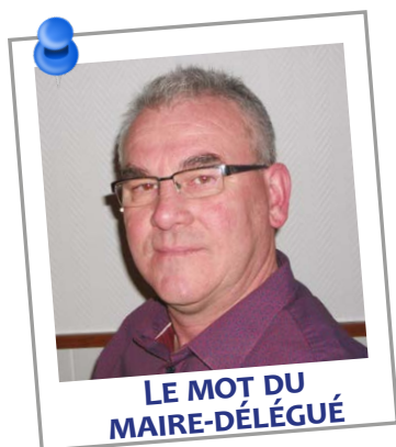
LE MOT DU MAIRE-DÉLÉGUÉ

Chers Saint Pierraises et saint Pierrais,