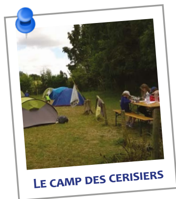
LE CAMP DES CERISIERS