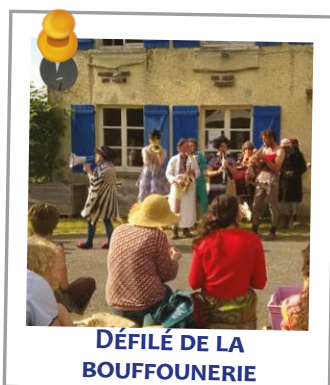
DÉFILÉ DE LA BOUFFONNERIE

Durant l'été, nos partenaires les plus proches nous sont restés fidèles. Récréa a proposé plusieurs mini-séjours par chez nous (il en reste encore des traces aujourd'hui sous forme de cabanes) et l'ATVS a organisé une randonnée accompagnée par des ânes sur notre beau territoire de Saint-Pierre et de Montamy.