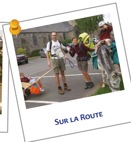
SUR LA ROUTE