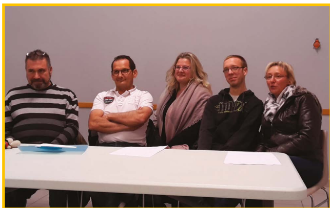
Photo bureau du comité

Le 15 avril était organisé par les membres du Comité des Fêtes et les membres de l'ex-club des Séniors le jambon au cidre à la Salle des Fêtes.