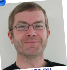
LE MOT DU MAIRE-DÉLÉGUÉ