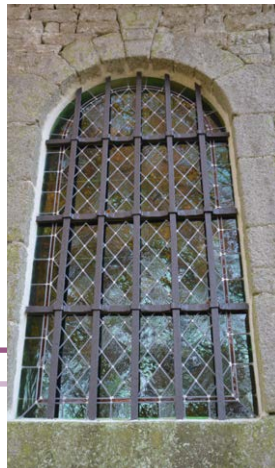
Fenêtre après travaux