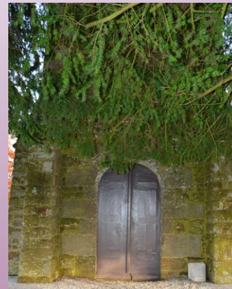
Travaux de peinture