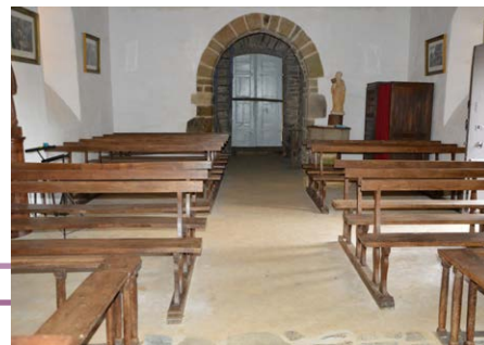
Sol et mur après travaux