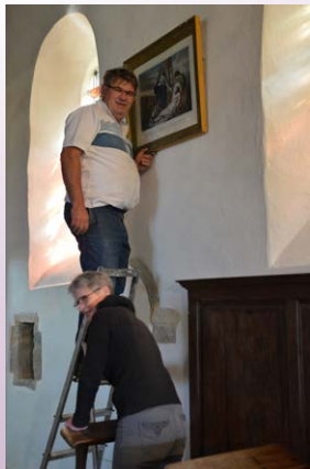
Remise en place du mobilier