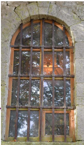
Fenêtre avant travaux