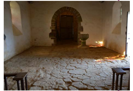
Sol et mur avant travaux