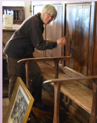
Nettoyage du mobilier