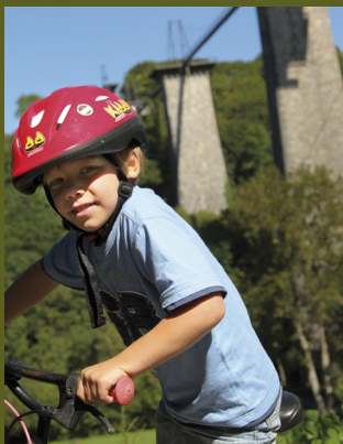
Viaduc de la Soulevure

DÉCOUVRIR DES CHEMINS HISTORIQUES... À VÉLO