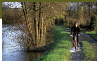
Vallée de la Vire